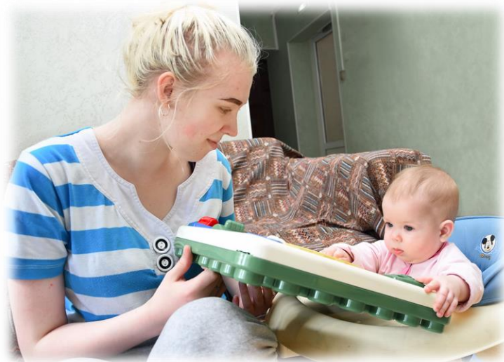
Учимся с мамой