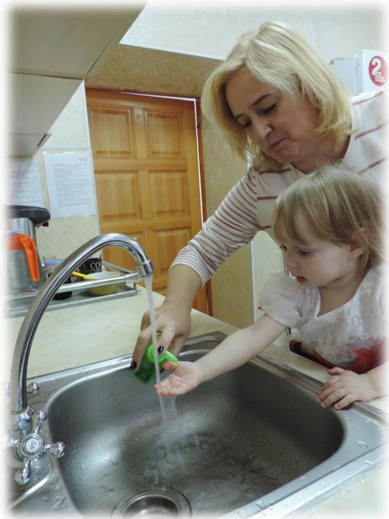
День чистых ручек