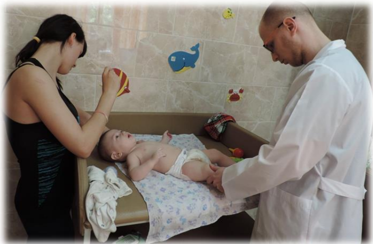
Неотложная медицинская помощь