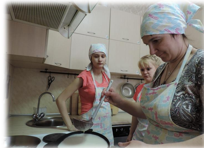
Блины – дело тонкое