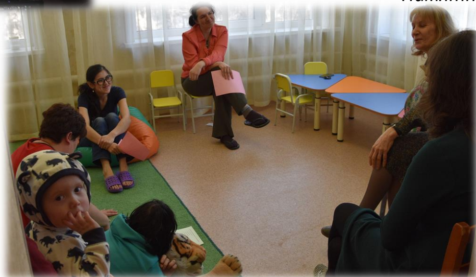
Размышляем вместе с психологом о жизни