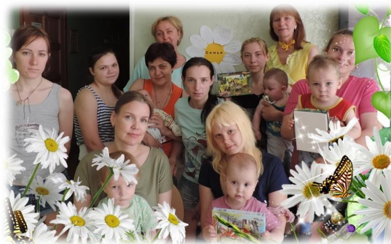
Памятные дни вместе