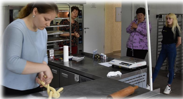
Экскурсия в Новосибирский колледж пищевой промышленности и переработки