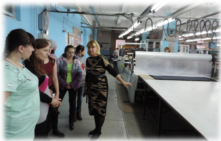
Экскурсия в мастерские крупнейшего за Уралом предприятия лёгкой промышленности АО «Синар»