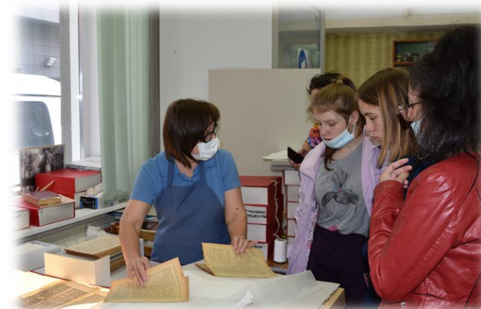
В гостях у реставратора. Экскурсия в Новосибирскую областную научную библиотеку