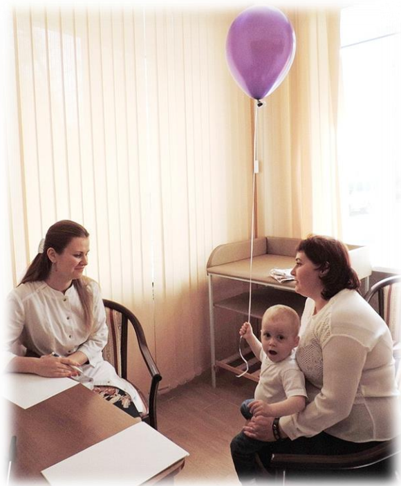
Беседа с педиатром