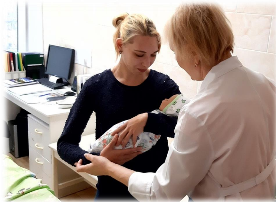
Сначала учимся на куклах