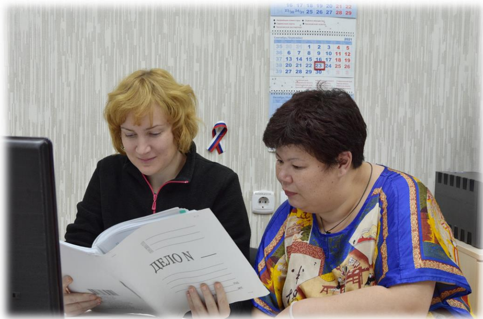
Консультация у юрисконсульта