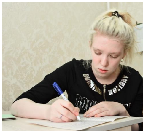
Домашние задания в школе никто не отменял