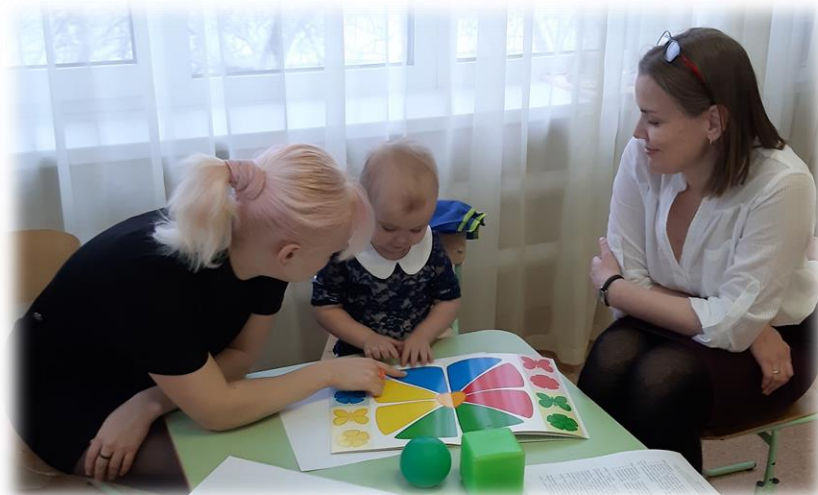
На занятиях у педагога