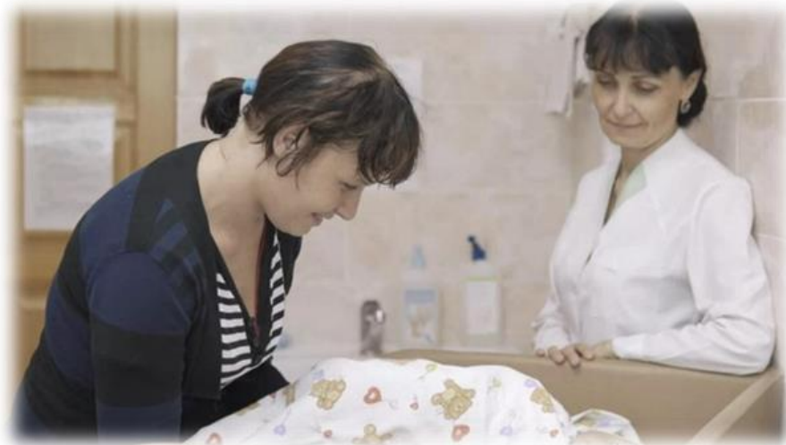
Уже самостоятельная мама