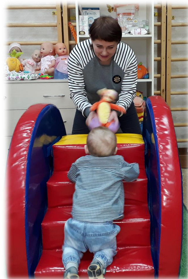
Вперед! К цели!

Психолого-педагогические занятия по развитию и воспитанию детей