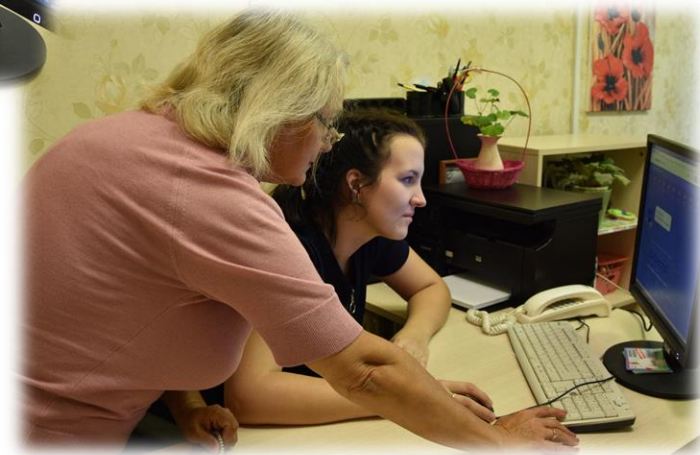
Учимся оформлять пособия

Правовая поддержка по решению трудной жизненной ситуации