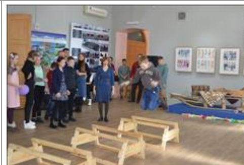
"День оленевода и охотника". Соревнования по национальным видам спорта. 15.03.2020. Прыжки через "нарты".