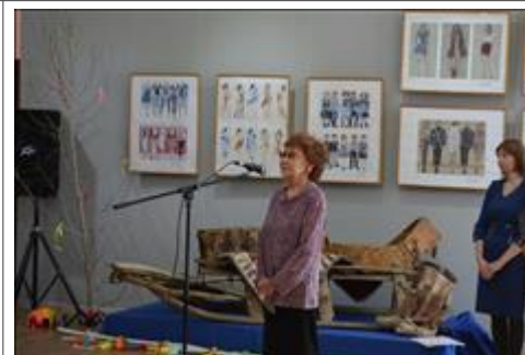
"День оленевода о охотника". Выступление представителей КМНС. 15.03.2020