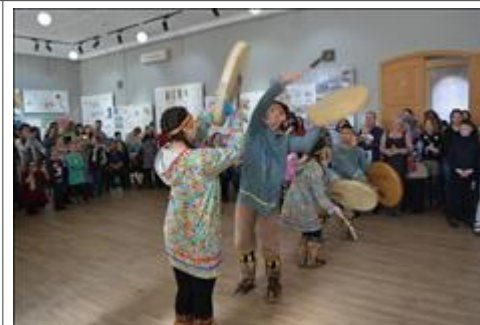
"День оленевода и охотника". 15.03.2020. Выступление молодёжного состава народного ансамбля Северного танца Дюгэлдын (Амурский областной дом народного творчества г. Благовещенск).