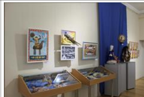
Выставка по результатам конкурса "Мир таёжных людей". https://www.instagram.com/p/B96UbK8q_Of/?igshid=wglaa5z2f29x

Мероприятие: Массовое праздничное мероприятие - Всероссийская акция "Ночь музеев". Онлайн-экскурсия и прямой эфир - "Фронтовые истории Амурских эвенков"