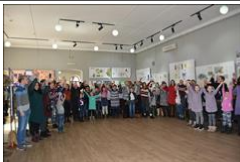
Посетители праздника "День оленевода и охотника" 15.03.2020 http://museumamur.org/news/vargan-pod-rok-khity-i-chay-s-tayezhnym-sborom-v-kraevedcheskom-muzee-proydet-den-olenevoda-i-okhotn/

Мероприятие: Массовое праздничное мероприятие "День оленевода и охотника" в музее.