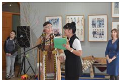
"День Оленевода и охотника". Награждение представителей родовой общины "Лалигир". 15.03.2020