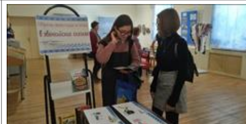
"День оленевода и охотника". 15.03.2020.