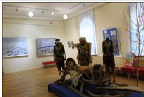
Вид зала этнографического центра "Бидекит". Временные выставки, до изготовления реквизита и монтажа постоянной экспозиции.

Мероприятие: Массовое праздничное мероприятие "День оленевода и охотника" в музее.