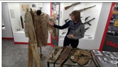
Всероссийская акция "Ночь музеев". "Фронтовые истории Амурских эвенков" https://www.instagram.com/tv/CAPsixRqGar/?igshid=70b0dp1n8wx

Мероприятие: Массовое праздничное мероприятие - Всероссийская акция "Ночь музеев". Онлайн-экскурсия и прямой эфир - "Фронтовые истории Амурских эвенков"