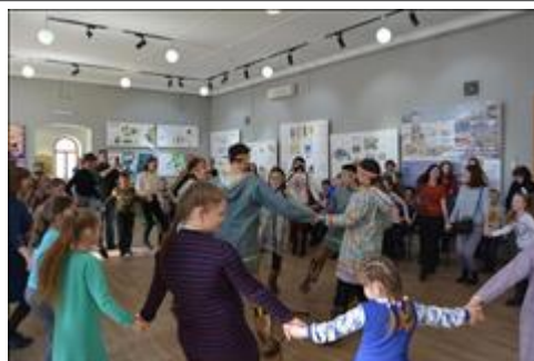
Мастер-класс по эвенкийскому национальному хороводу "Дэвэйдэ". Молодёжный состав народного ансамбля Северного танца Дюгэлдын (Амурский областной дом народного творчества г. Благовещенск).