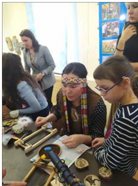
Мастер-класс по бисероплетению. 15.03.2020.