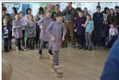
"День оленевода и охотника". Национальные игры. 15.03.2020