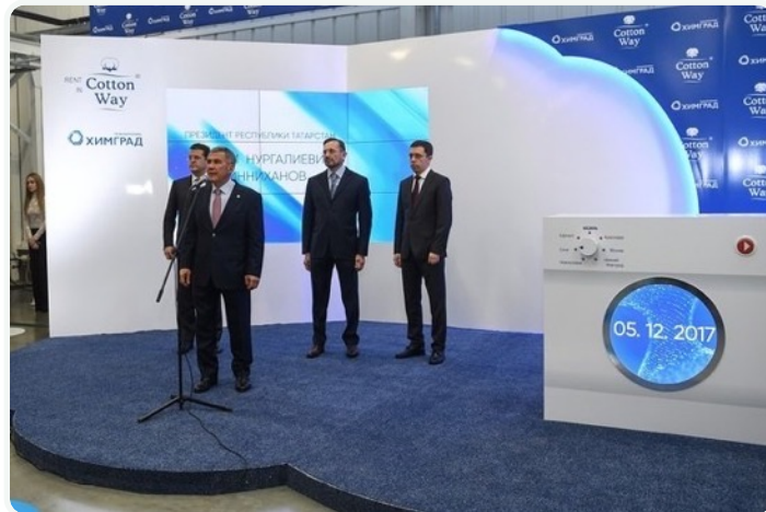
Президент Татарстана Р.Минниханов на открытии фабрики-прачечной Cotton Way в Казани