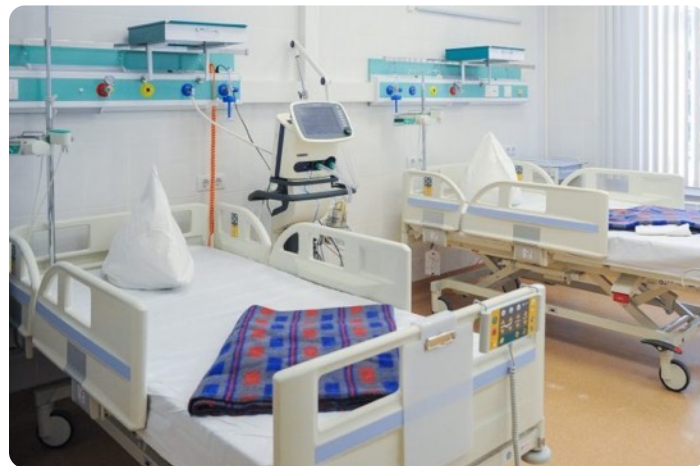
Москва (больница им. Боткина)