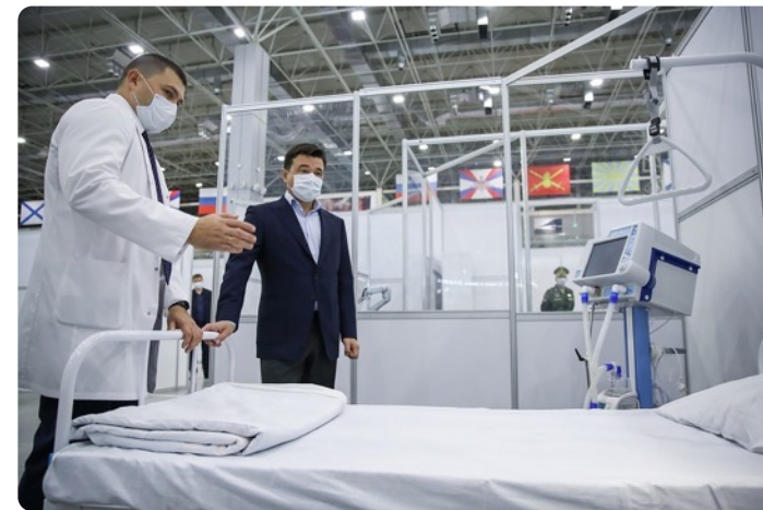
Московская область (губернатор А.Воробьев на открытии временного госпиталя)