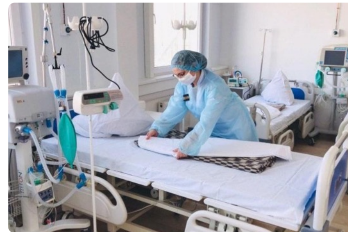
Тюмень (ОКБ 1)