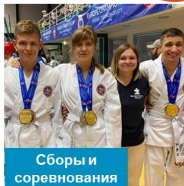
Сборы и соревнования