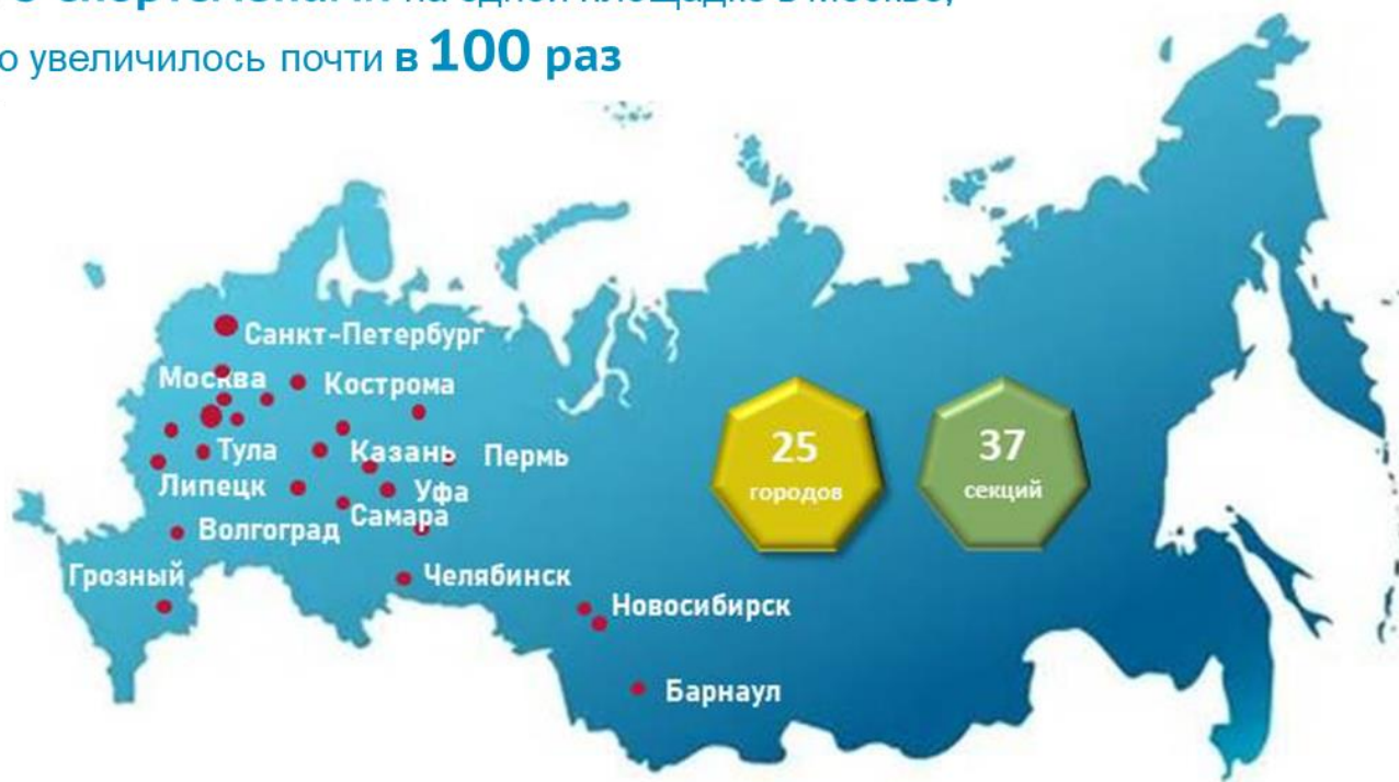
Количество адаптивных спортсменов