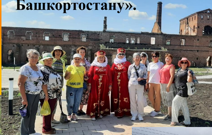
Проект «Путешествия по родному Башкортостану».