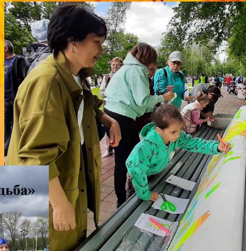
Проект «Делись добром»