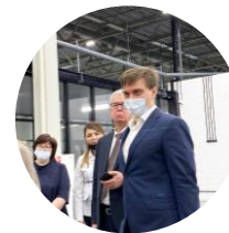
Виктор Неумывакин Директор департамента Минпросвещения России