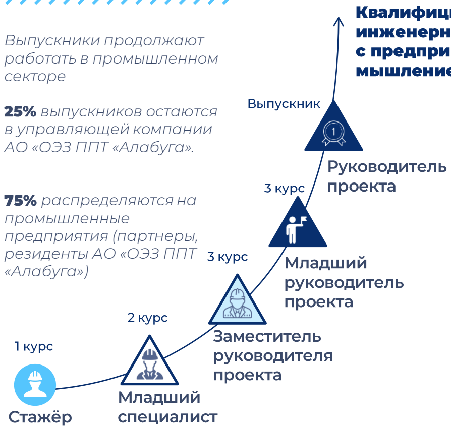
Схема дуального обучения

75% распределяются на промышленные предприятия (партнеры, резиденты АО «ОЭЗ ППТ «Алабуга»)