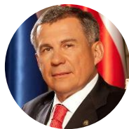
Минниханов Рустам Нургалиевич Президент Республики Татарстан