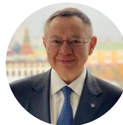
Файзуллин Ирек Энварович Министр строительства и жилищно- коммунального хозяйства РФ