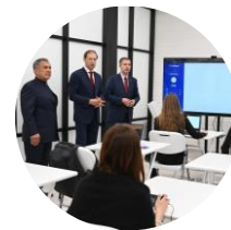
Денис Мантуров Министр промышленности и торговли РФ