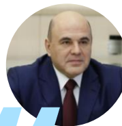
Мишустин Михаил Владимирович Председатель Правительства РФ

России крайне важно в кратчайшие сроки достичь технологической независимости, которая базируется на крепкой и диверсифицированной промышленности.**