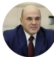
Мишустин Михаил Владимирович Председатель Правительства РФ