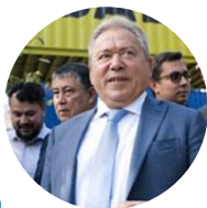
УЛЬФАТ МУСТАФИН Глава администрации городского округа город Уфа