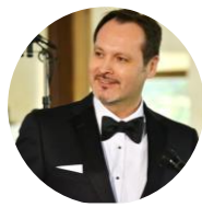
АСКАР АБДРАЗАКОВ оперный певец, Народный артист Башкортостана