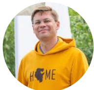
РУСЛАН ХАБИБОВ министр молодежной политики и спорта Республики Башкортостан