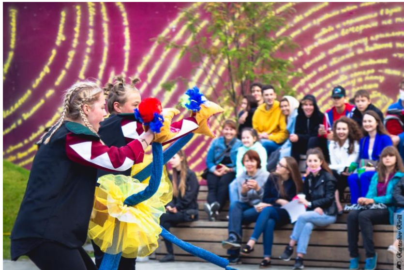
ФЕСТИВАЛЬ АНТИШАБЛОННОГО ТВОРЧЕСТВА «ОПЕРЕНИЕ» КОНСТАНТИНА ХАБЕНСКОГО