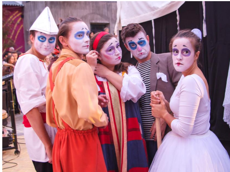
ФЕСТИВАЛЬ УЛИЧНЫХ ТЕАТРОВ «АЙДА ФЕСТ»