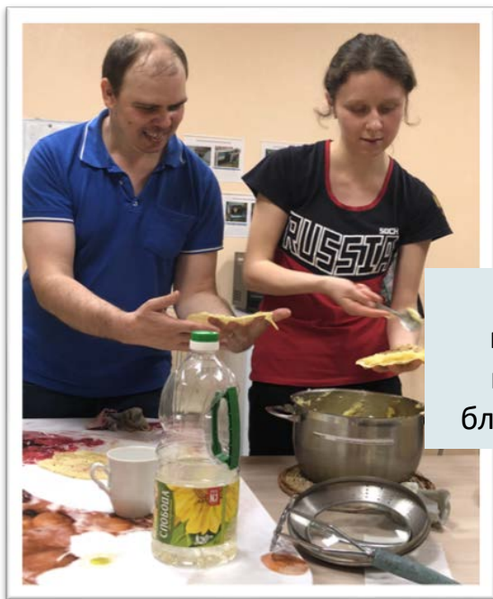
Обучение приготовлению национального блюда «кыстыбый»