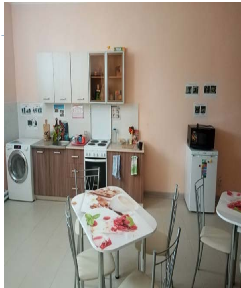
Комната социально-бытовой адаптации «Кухня»

100% домов-интернатов для лиц с инвалидностью реализуют обучение навыкам самостоятельной жизни с использованием