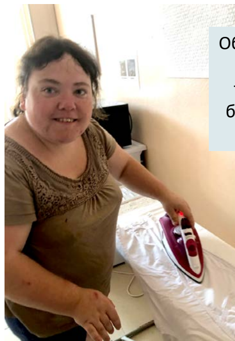
Обучение технике глажки белья: подбор температуры, техника безопасности, алгоритм работы