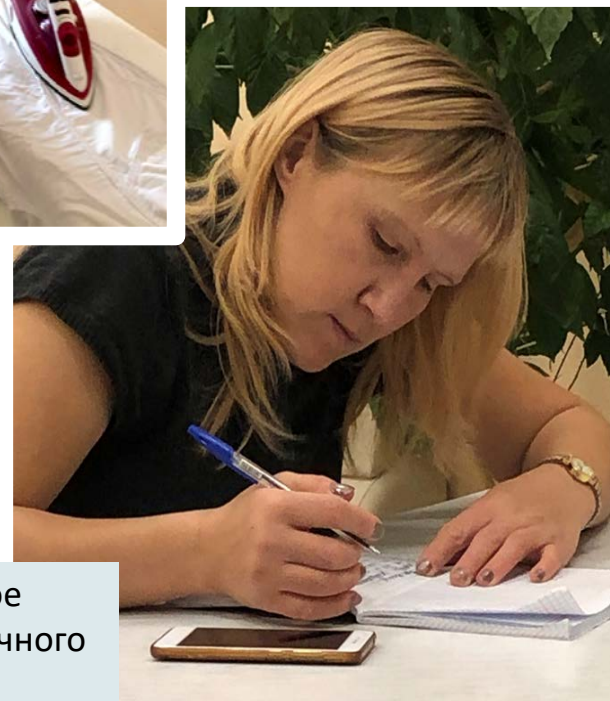
Ежедневное заполнение личного дневника