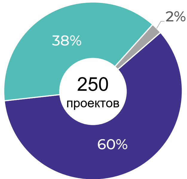
Поданные идеи по типологии