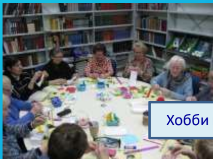
Хобби и увлечение