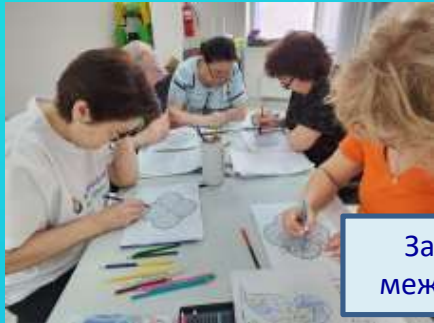
Занятие на развитие межполюшарных связей