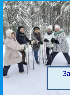
Занятия на свежем воздухе