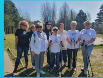
Участие в городских соревнованиях