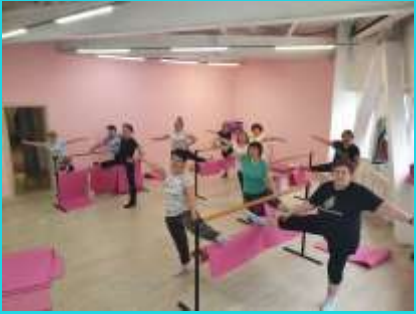
Занятия физической культурой