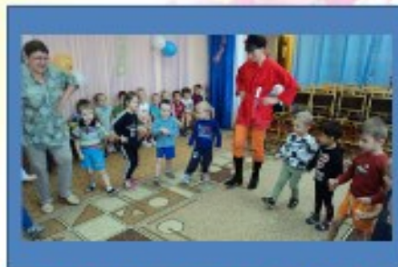
2018 – 2020 годы Детский сад №32

49 лет назад, в 1973 году, судьба привела её в стены детского ясли-сада №1, и жизнь приобрела новый смысл, начался новый этап - этап становления её, как профессионала, педагога-важблннка, дарящего детям сказку.