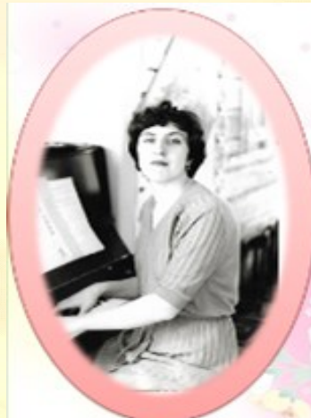
1973 год Детский сад №1

Музыкальный руководитель — уникальная профессия, которая требует не только знаний и умений, но и душевной чуткости, духовной искренности, профессиональной деликатности и универсальности.