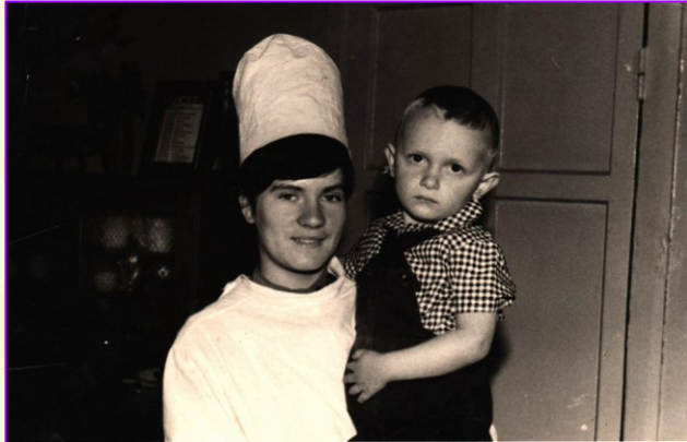
1967 г. медицинская сестра детских яслей № 1 ЗИД