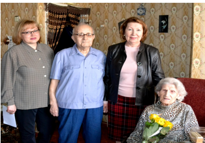
Уважаемые получатели социальных услуг, ждем Ваши истории жизни, истории семьи, профессиональные истории!