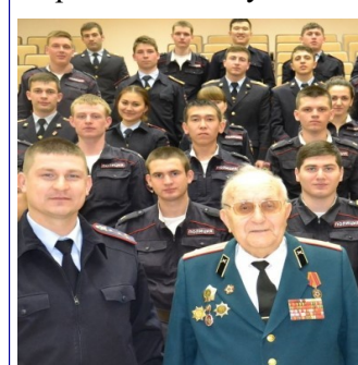
На фото - Поздравление курсантов с 71-й годовщиной Великой Победы (май 2016 г.)