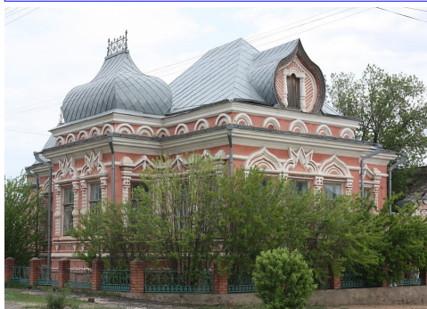
На фото: Дом купца Жемарина— https://ru.wikipedia.org/wiki/Дубовка