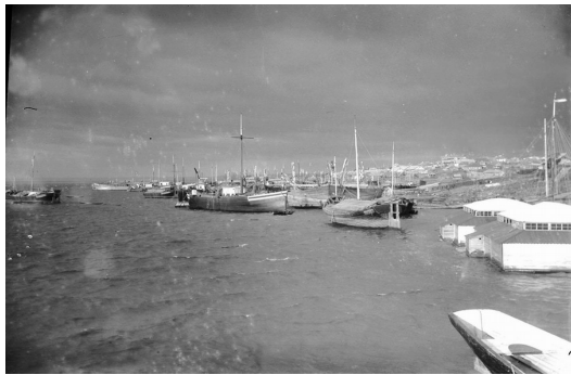
На фото: Дубовские пристани - http://царницын.рф/gubernia/dubovka/42-vidy-dubovki.html

Уважаемые получатели социальных услуг АНО СОН «Опора»! Информировем вас о том, что на втором этапе разработанного организацией проекта «Социальный маршрут: Волгоград для всех!» 9 ноября 2018г. была проведена вторая автобусная экскурсия в г. Дубовка , о которой мы хотим рассказать в нашей газете.