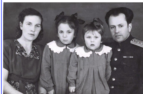
Семья. Фото 1955г.