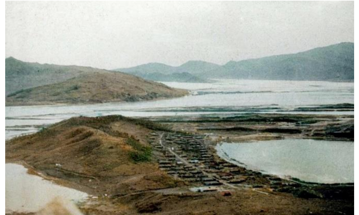
Места, где разворачивались Хасанские события.