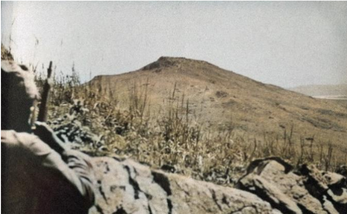
Японский солдат на одной из сопок. Август 1938 г.

В качестве иллюстраций текста использованы архивные фотографии, часть из которых раскрашены вручную.