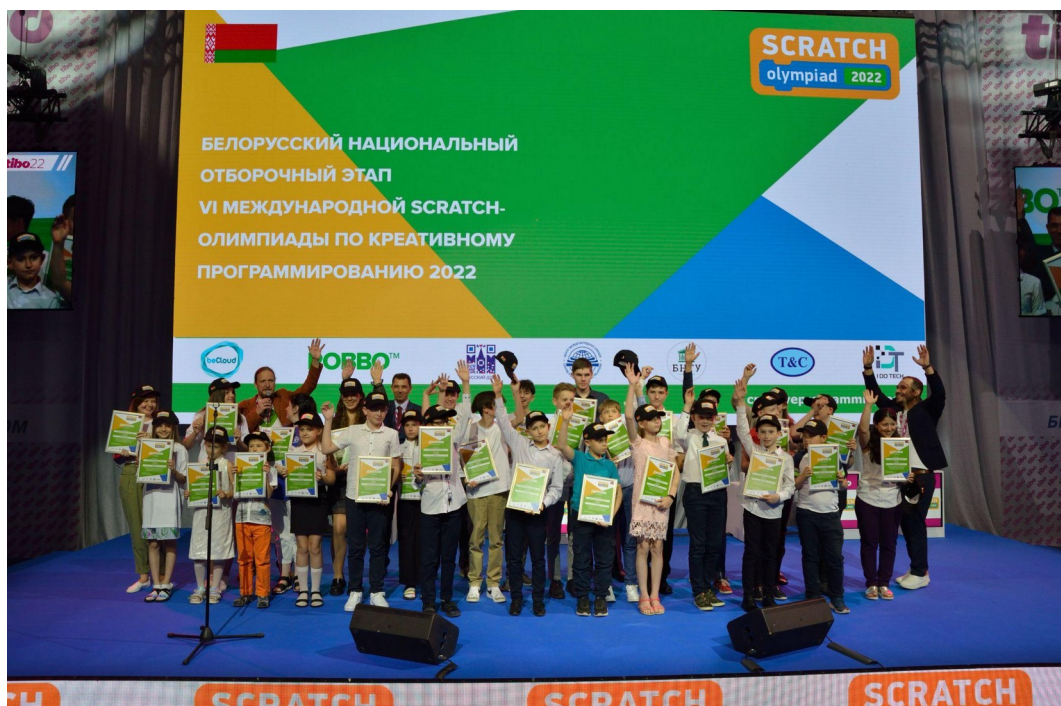
Фото 1: Призеры белорусского национального этапа олимпиады