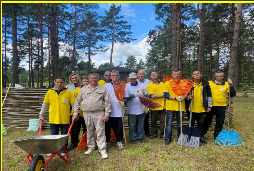
Акция «Помощь рядом»