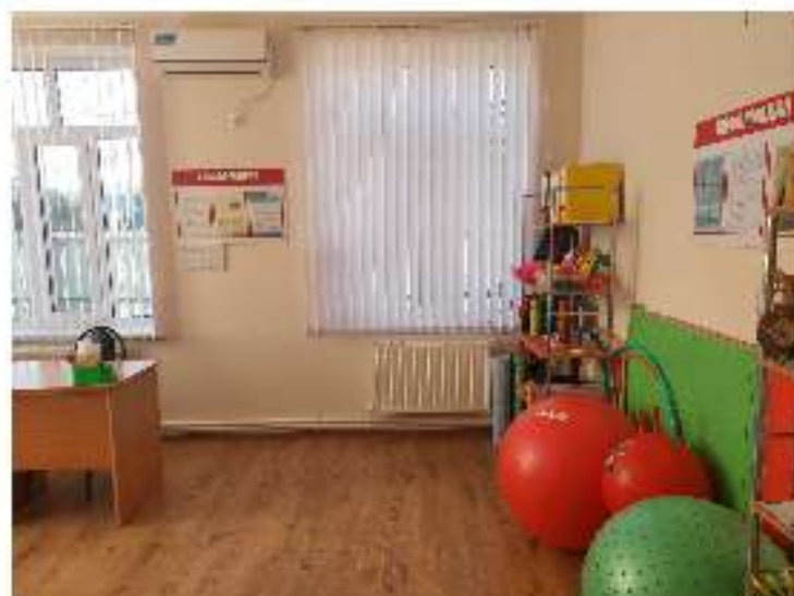
РАБОЧАЯ ЗОНА ВОЛОНТЕРОВ