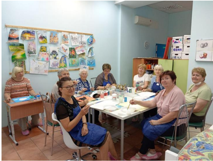
Фото с довольными бабушками)