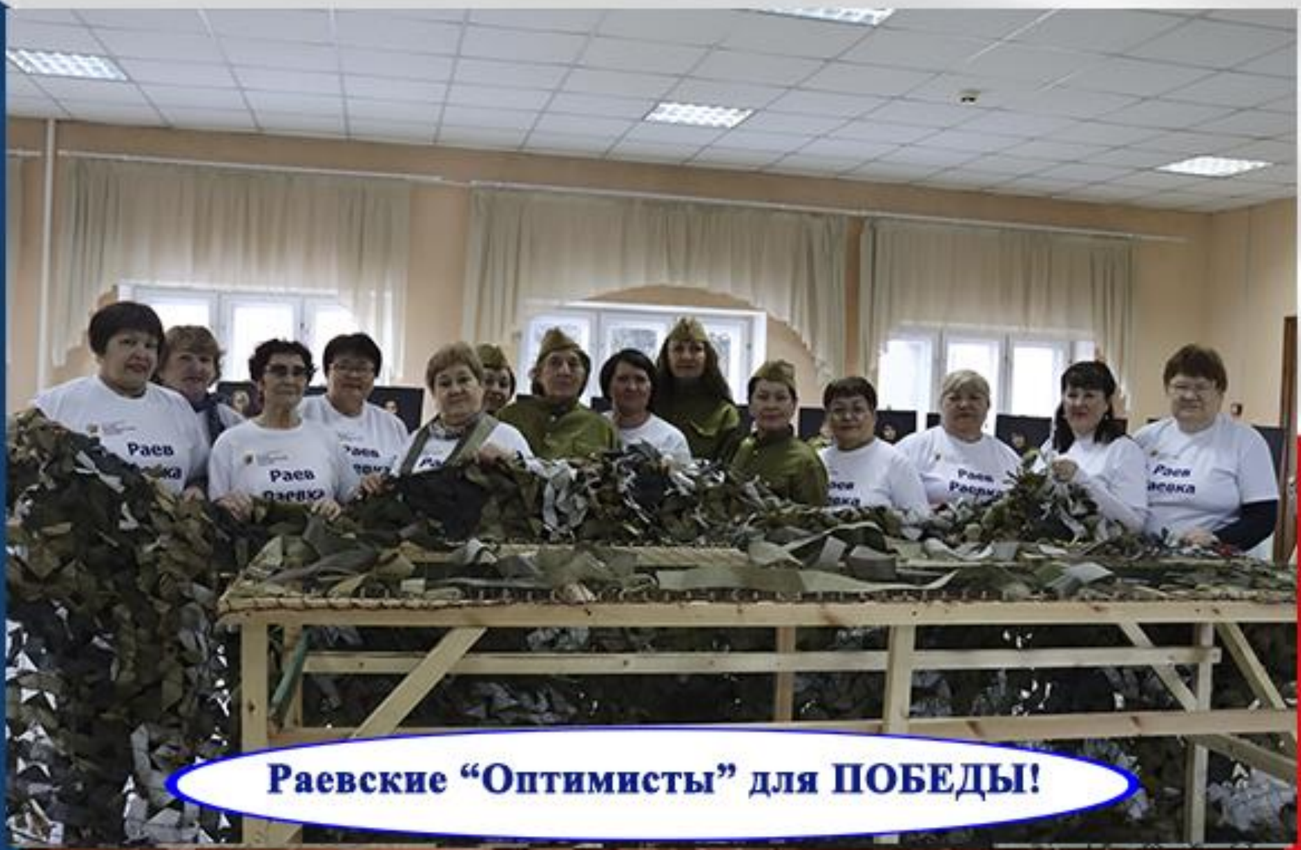
Раевские “Оптимисты” для ПОБЕДЫ!