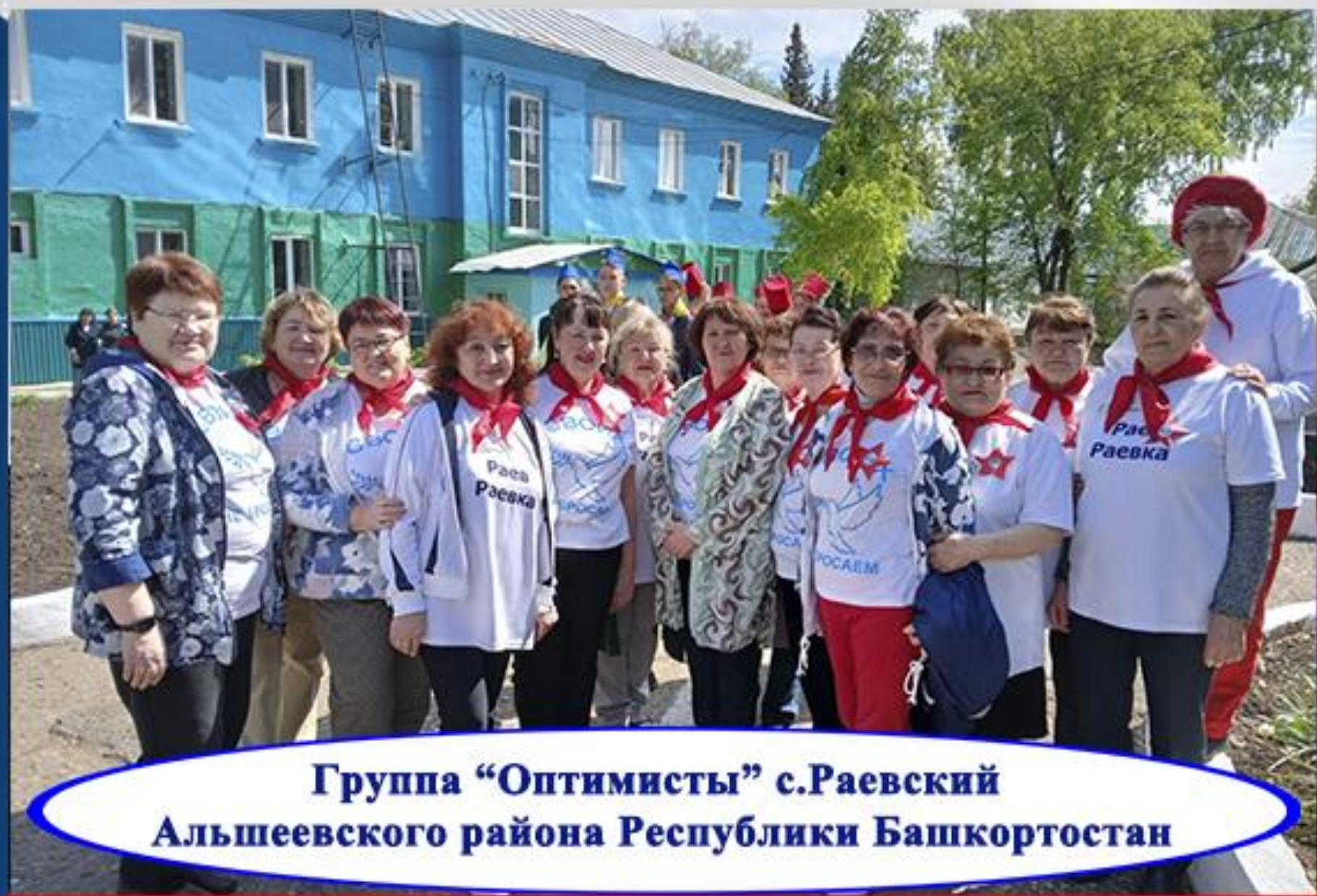
Группа “Оптимисты” с.Раевский Альшеевского района Республики Башкортостан