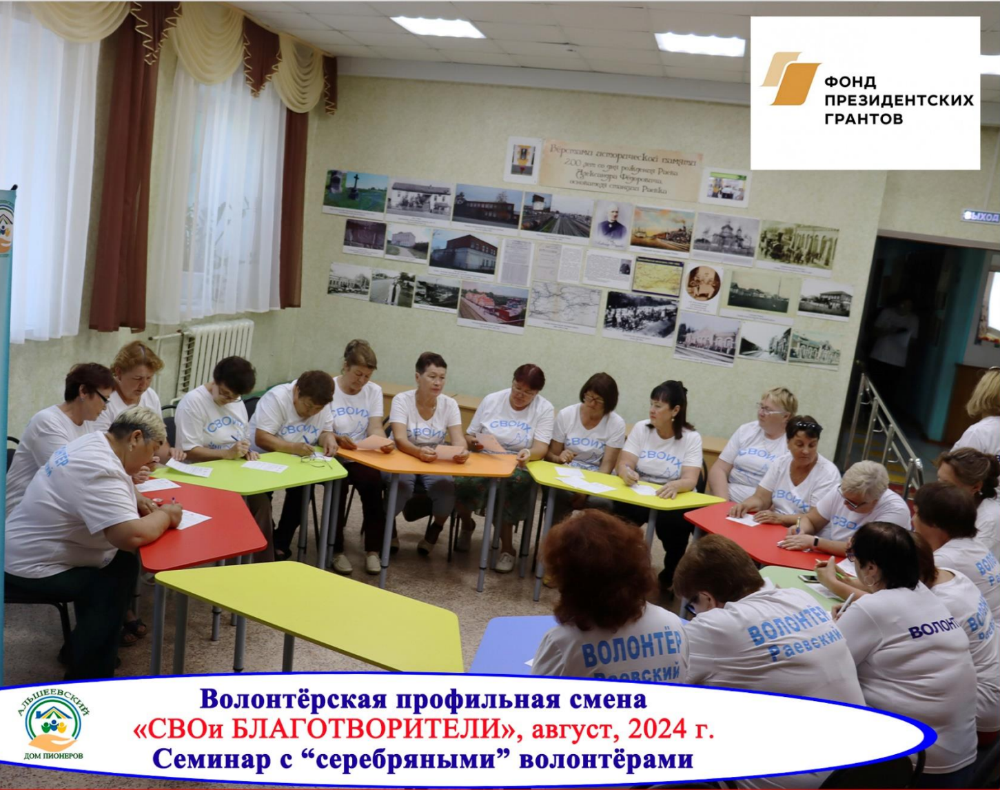
Волонтерская профильная смена «СВОи БЛАГОТВОРИТЕЛИ», август, 2024 г. Семинар с «серебряными» волонтерами