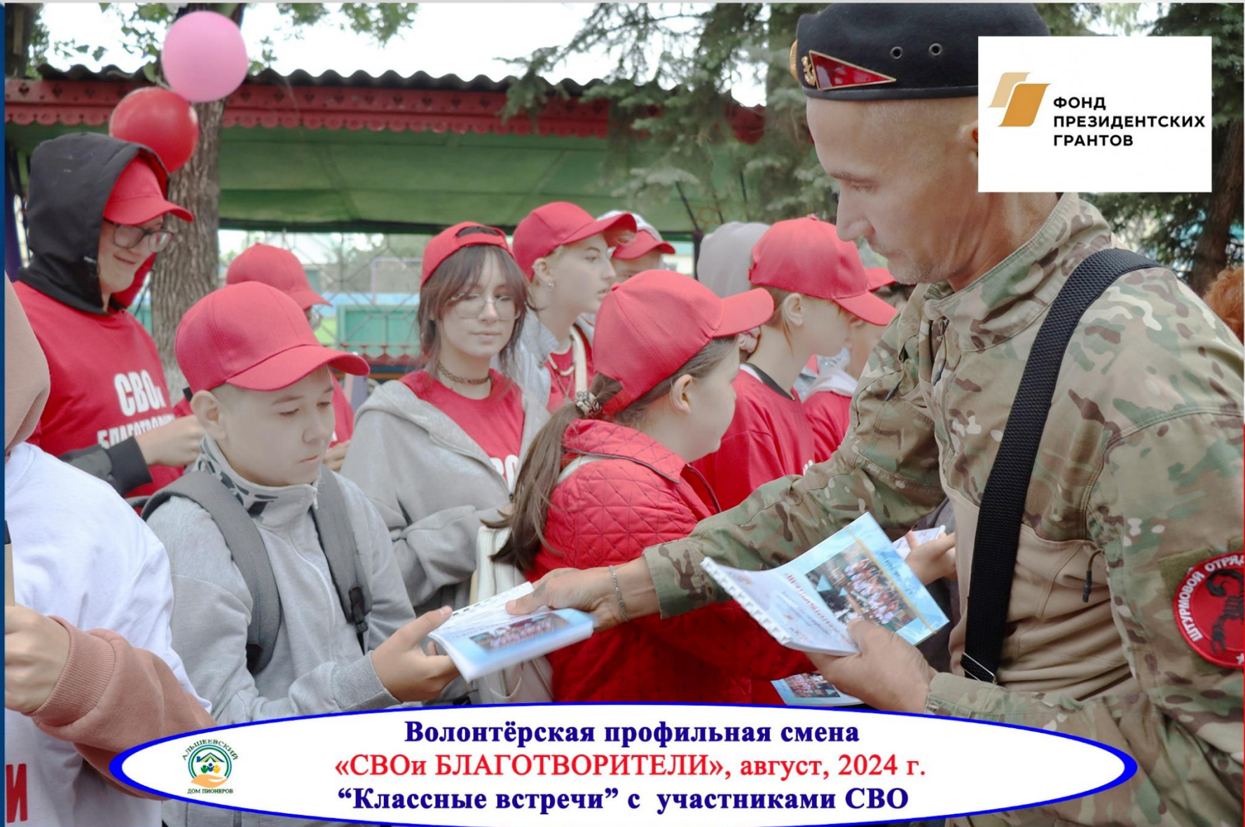
Волонтёрская профильная смена «СВОи БЛАГОТВОРИТЕЛИ», август, 2024 г. “Классные встречи” с участниками СВО