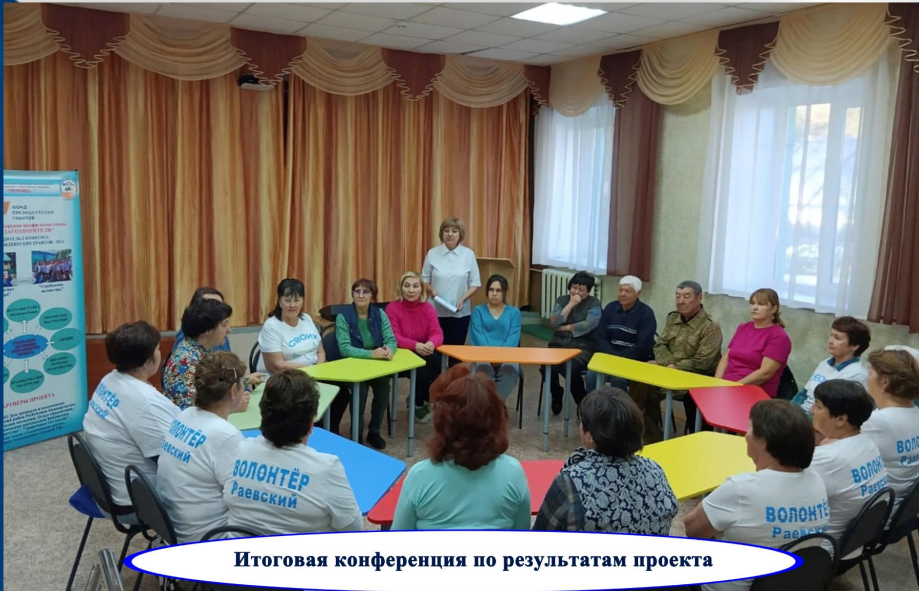
Итоговая конференция по результатам проекта