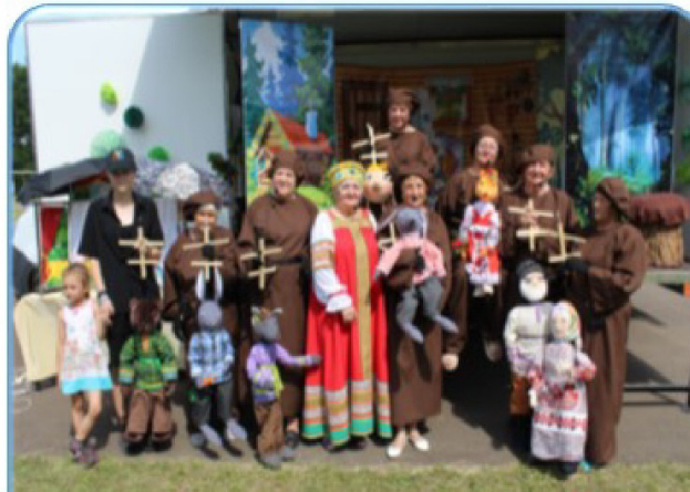
Театр кукол- марионеток «Орфей»