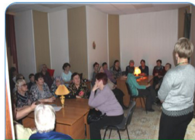
Викторины, брейн-ринг, «конструкторское бюро» и др.