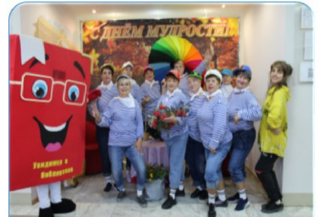
Танцевальный коллектив «Серебряный возраст»