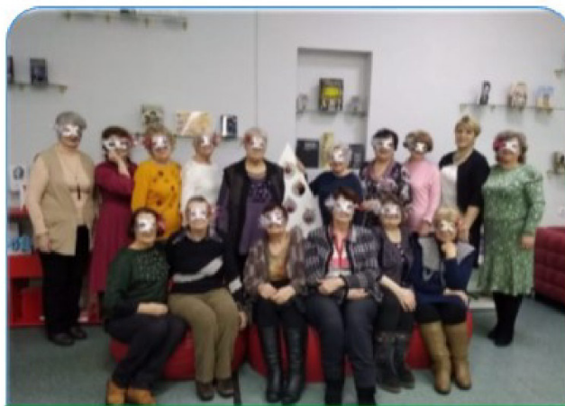
«Сувенир своими руками». Мастер- классы