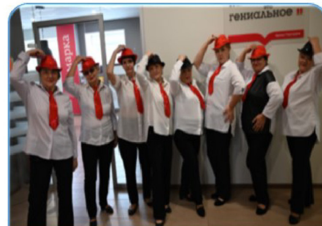
Танцевальный коллектив «Серебряный возраст»