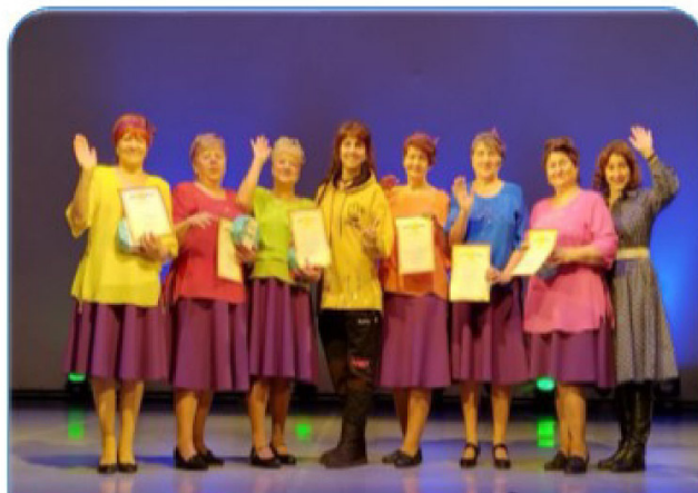
Активная жизненная позиция