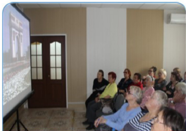
«Иллюзия реального путешествия»