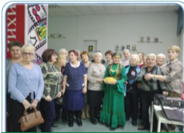
«Клуб виртуальных путешественников»