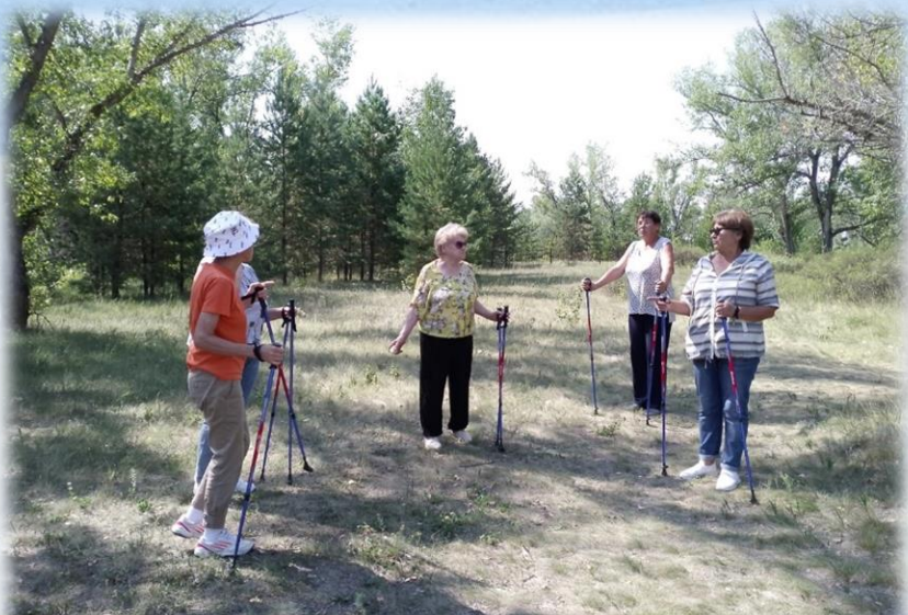
В оздоровительное путешествие отправились участницы проекта «Социальный