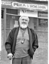
ПРИВЕТЬ ЕГО ЦЕЛЮ! Фильмы, когда не было серьезных проблем со здоровьем. Сейчас ситуация изменилась, и он чувствует себя лучше.