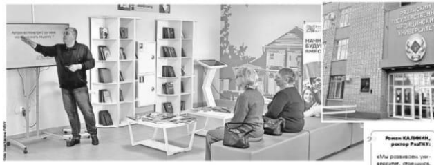
Рязанский медицинский центр не только готовит будущих врачей, но и является открытой площадкой для всех, кто заботится о своем здоровье

РЯЗАНСКИЙ МЕДИЦИНСКИЙ ЦЕНТР НЕ ТОЛЬКО ГОТОВИТ БУДУЩИХ ВРАЧЕЙ, НО И ЯВЛЯЕТСЯ ОТКРЫТОЙ ПЛОЩАДКОЙ ДЛЯ ВСЕХ, КТО ЗАБОДИТСЯ О СВОЕМ ЗДОРОВЬЕ