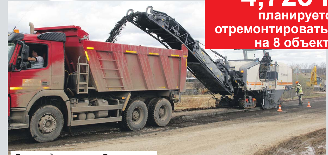
Ремонт дороги по ул. Восточная.

4,723 км планируется отремонтировать в 2022 г. на 8 объектах