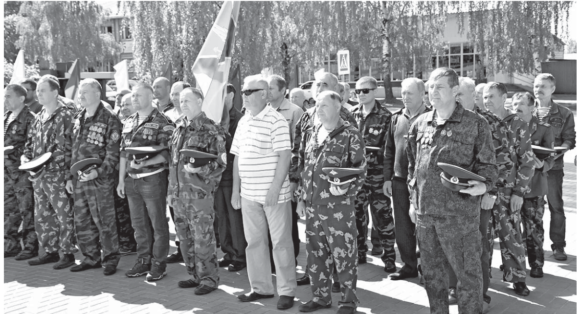
День пограничника в Селтах. Фото от 28 мая 2021 г.

Нынче исполняется 104 года с 28 мая 1918 года, когда Декретом Совета Народных Комиссаров была учреждена Пограничная охрана РСФСР, прямой преемницей которой является современная Пограничная служба ФСБ России.