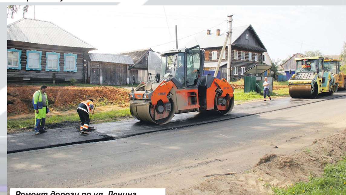
Ремонт дороги по ул. Ленина.