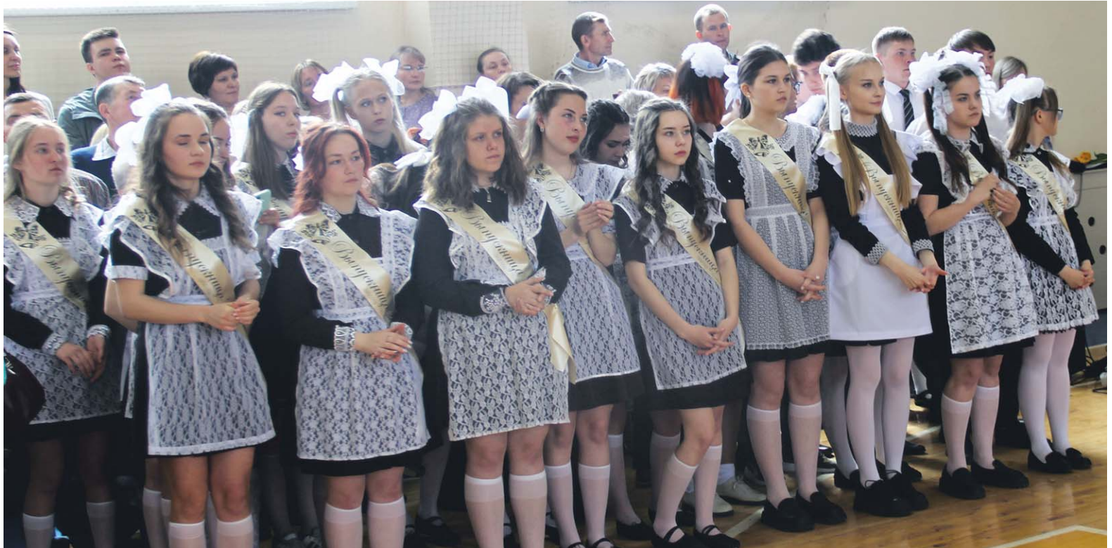
Выпускники 11-х классов 2022 года.